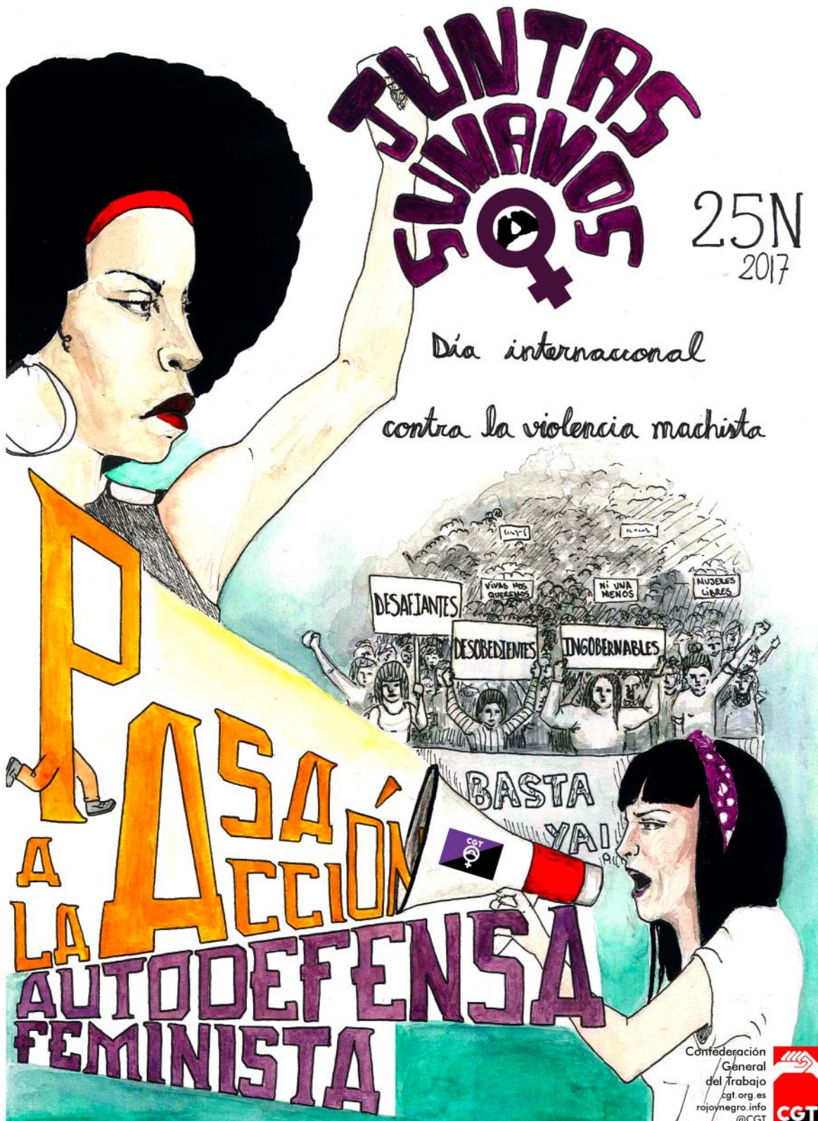
Día internacional contra la violència masclista